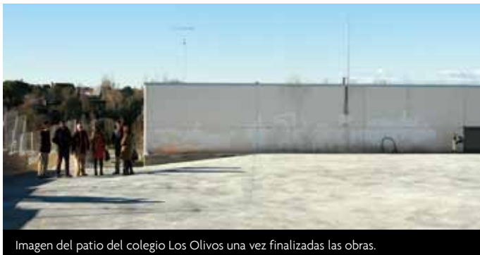
Imagen del patio del colegio Los Olivos una vez finalizadas las obras.

El alcalde de Las Rozas, José Ignacio Fernández Rubio visitó hace unos días el colegio público Los Olivos para comprobar in situ el resultado de las obras de mejora que ha llevado a cabo el Ayuntamiento en el patio superior del centro. Con una superficie de casi 1.000 m 2 (765 m 2 de solera, dejando el resto -zona de las encinas- en terreno natural a petición del colegio) y lindando con el encinar del parque natural del Alto Lazarejo, este privilegiado espacio se ha puesto en valor para que los más de 600 alumnos matriculados en el centro puedan disfrutarlo durante los recreos.