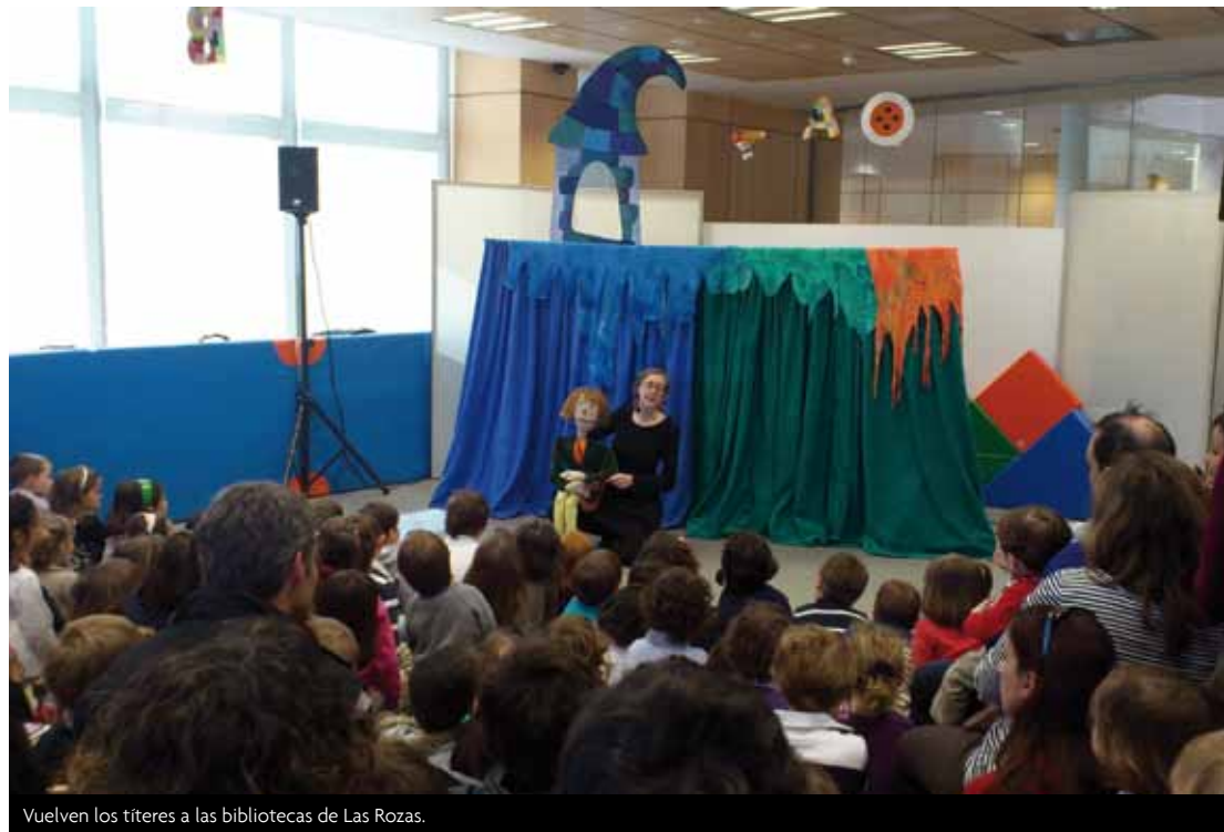
Vuelven los títeres a las bibliotecas de Las Rozas.

Con “Abril de Libro”, que se desarrollará durante todo el mes en las tres bibliotecas municipales, vuelven los Títeres por primavera para traer a los más pequeños historias como “La princesa y la rana”, “Los tres cerditos” o “Los siete cabritillos”. Además, los dos primeros viernes de abril, al terminar “La hora del cuento” los niños y niñas asistentes podrán participar en la tercera edición del concurso de marcapáginas, cuya entrega de premios y diplomas a los ganadores tendrá lugar el 25 de abril.