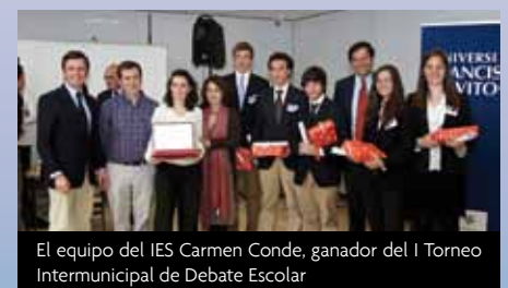
El equipo del IES Carmen Conde, ganador del I Torneo Intermunicipal de Debate Escolar

Ambas iniciativas combinan los elementos propios de una sana competición con un amplio programa de formación, previo a la fase de competición, dirigido a alumnos y profesores para alcanzar los objetivos formativos y pedagógicos que pretende. Además, constituyen una oportunidad única para la convivencia y el intercambio de experiencias entre los distintos centros.