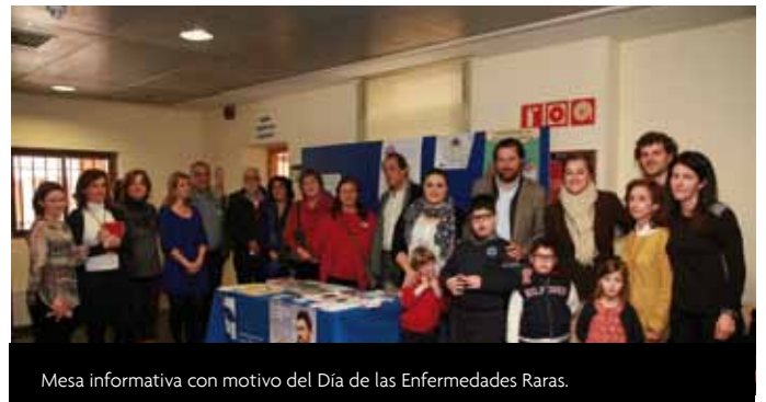
Mesa informativa con motivo del Día de las Enfermedades Raras.

Varios miembros de la Corporación municipal han apoyado también con su presencia esta campaña que viene a refrendar la Declaración Institucional aprobada en el último Pleno municipal donde la cámara expresó su solidaridad con los enfermos y familiares y se comprometió a considerar el Día Mundial de las Enfermedades Raras como una oportunidad para dar apoyo y esperanza a los enfermos, sensibilizar a la población y potenciar los programas y campañas para acabar con la discriminación de estas personas.