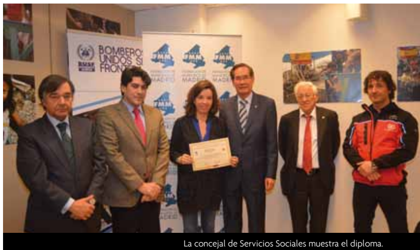
La concejal de Servicios Sociales muestra el diploma.

para poder ayudar en casos de emergencia humanitaria, se envió a la zona a través de Cruz Roja, una de las ONG's que han trabajado en la región afectada y cuyas actuaciones se han recogido en un reportaje fotográfico que se mostró durante el acto.