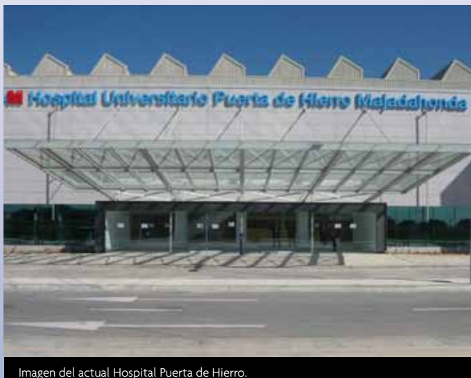
Imagen del actual Hospital Puerta de Hierro.

Puerta de Hierro, el centro médico de referencia de Las Rozas que este año cumple su 50 aniversario como Hospital Universitario ya en su nueva ubicación en Majadahonda.