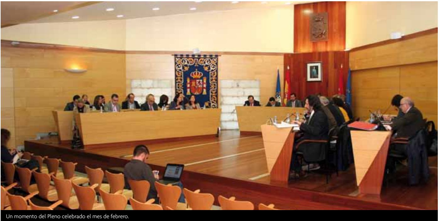
Un momento del Pleno celebrado el mes de febrero.

El Pleno aprueba por unanimidad dedicar un espacio público de la ciudad a la memoria de Nelson Mandela y Luis Aragonés