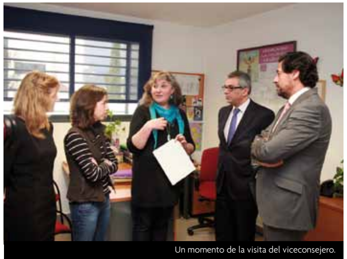
Un momento de la visita del viceconsejero.

cionales del Punto realizaron más de 1.900 atenciones individualizadas de tipo psicológico, social, jurídico y educativo. El Punto cuenta además con la colaboración del resto de profesionales de la Concejalía de Servicios Sociales y del área de la Concejalía de Familia y Menor, quienes trabajan activamente en la detección, prevención, atención psicosocial y derivación de las víctimas desde sus respectivos Programas.