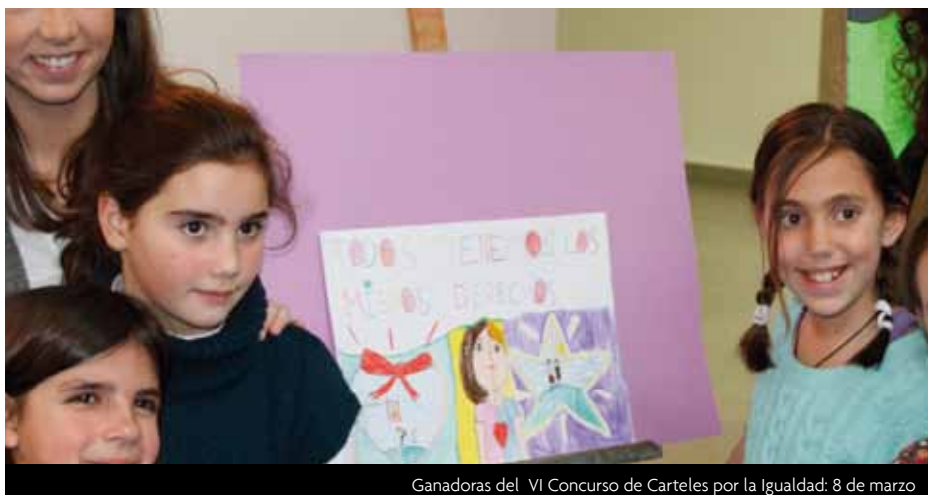
Ganadoras del VI Concurso de Carteles por la Igualdad: 8 de marzo

Además de estas propuestas, el Área de Mujer de la Concejalía de Servicios Sociales de Las Rozas organiza a lo largo del año numerosos talleres dentro de su programa de promoción de la igualdad de derechos y oportunidades, impulso y apoyo a la conciliación, fomento de la corresponsabilidad de hombres y mujeres en todos los ámbitos e integración y participación social de las mujeres en el municipio. El programa detallado de todas estas actividades, incluidas las de la XXIII Semana de la Mujer, está disponible en la Concejalía de Servicios Sociales (Centro Municipal El Abajón. Comunidad de La Rioja, 2) y en la web del Ayuntamiento ( www.lasrozas.es )