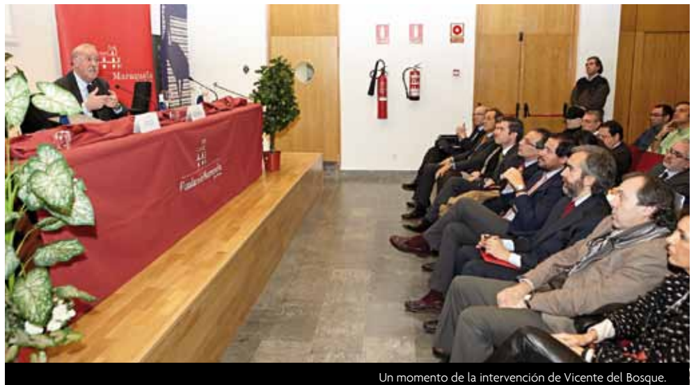
Un momento de la intervención de Vicente del Bosque.

El alcalde quiso además agradecer a Vicente del Bosque que haya aceptado ser patrono de honor de la Fundación Marazuela, una institución de iniciativa pública local que pretende fomentar la participación y colaboración de entidades, instituciones, personas y empresas en la vida cultural, deportiva y social del municipio y en cuyo Patronato de Honor figuran también nombres de la talla de Luis María Anson, Antón García Abril, Blanca Fernández Ochoa, Carlos Sainz, Fernando Hierro, Felipe Reyes y Juan Velarde.