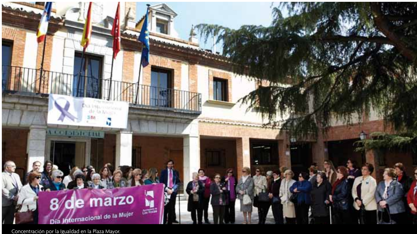
Concentración por la Igualdad en la Plaza Mayor.

La Concejalía de Servicios Sociales ha organizado una amplia programación de actividades para conmemorar el Día Internacional de la Mujer, que se celebra cada año el 8 de marzo. A lo largo de todo este mes hay conferencias, encuentros, talleres, jornadas, funciones de teatro, proyecciones, exposiciones y concursos que giran en torno a la figura de la mujer, actos que tienen su momento central en el tradicional Encuentro Homenaje al movimiento asociativo femenino del municipio y la Concentración por la Igualdad delante del Ayuntamiento.