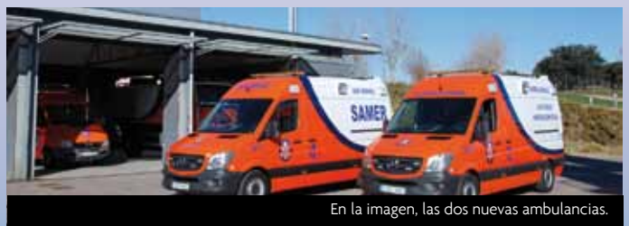
En la imagen, las dos nuevas ambulancias.

Los dos nuevos vehículos, modelo Sprinter de Mercedes, cuentan con todas las certificaciones requeridas en el R.D 836/2012 y la norma Europea UNE-EN 1789:2007+A1, para ambulancias de clase c y clase b.