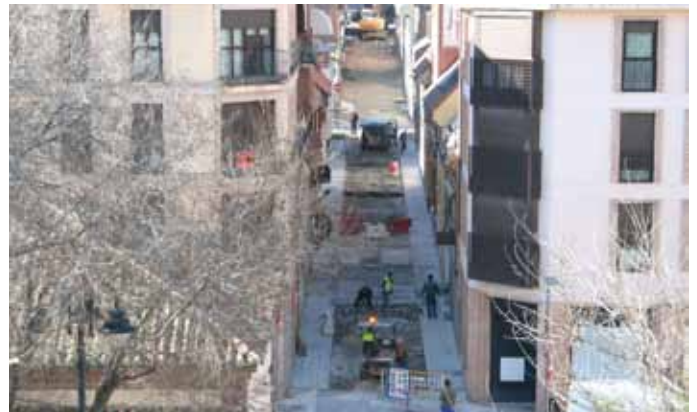
Imagen de las obras que se están acometiendo en la calle Ebro.

Las obras de la calle Ebro, que comenzaron a mediados del pasado mes de febrero y avanzan a buen ritmo, forman parte del Plan de Revitalización del Centro Urbano diseñadas para mejorar la accesibilidad del casco antiguo del municipio, hacerlo más transitable y ganar espacio público para el peatón.