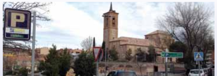
Aparcamiento de la Iglesia.

La principal novedad está en la tarifa preferente fijada para los vecinos de la zona de influencia del aparcamiento, que comprende el casco urbano y urbanizaciones aledañas como Maracaibo, Eurogar o La Hiedra. Los residentes en esta área, incluida en el Plan de Revitalización del centro urbano que está impulsando el Ayuntamiento, pueden acceder a una plaza para cada uno de sus vehículos por tan