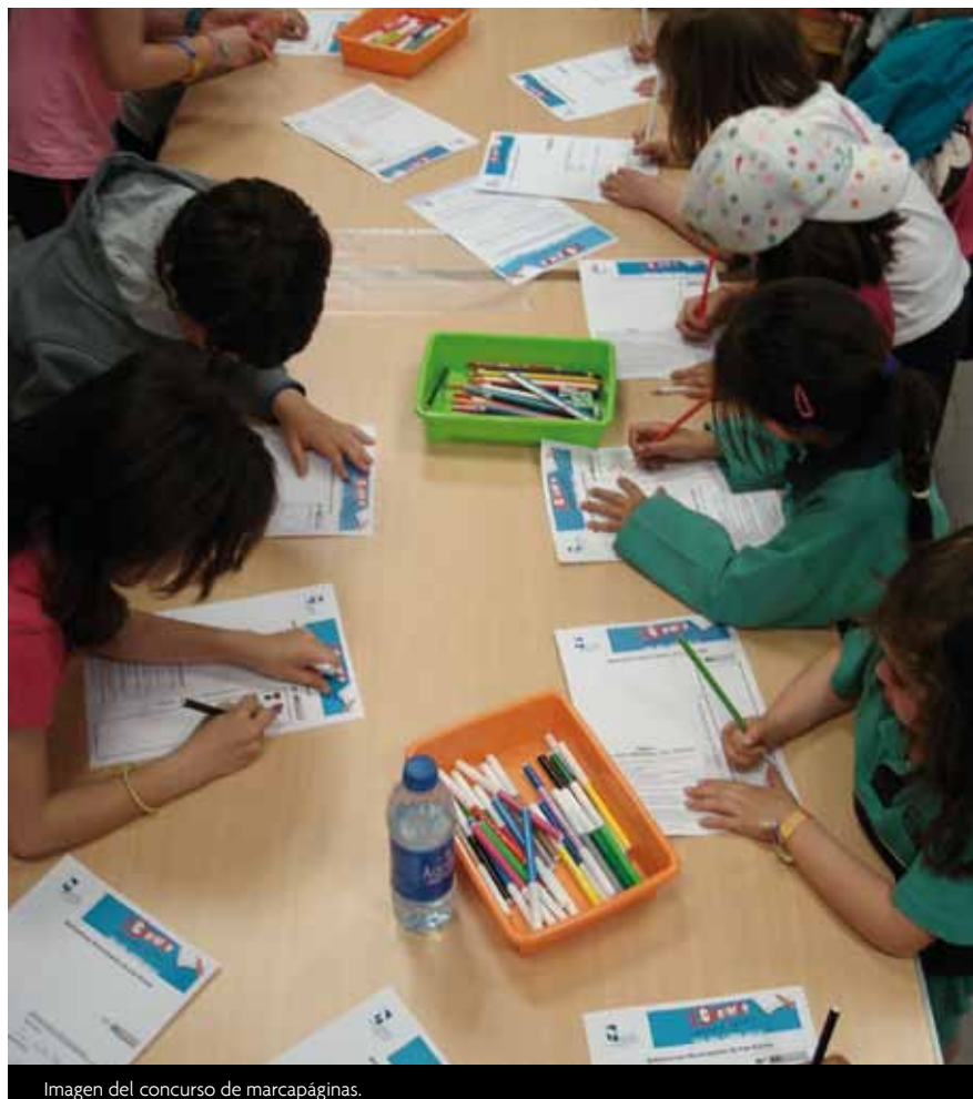
Imagen del concurso de marcapáginas.