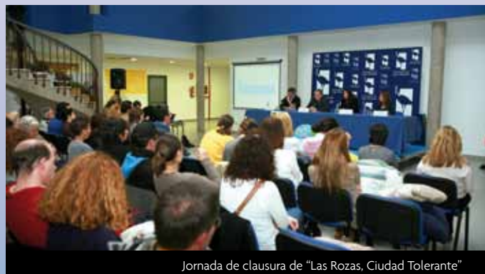
Jornada de clausura de “Las Rozas, Ciudad Tolerante”