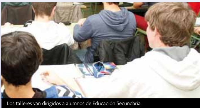
Los talleres van dirigidos a alumnos de Educación Secundaria.

El área de Familia y Menor ha programado una serie de talleres en centros de Educación Secundaria con el fin de prevenir el acoso escolar a través de la mejora del clima en las aulas y el fomento de un adecuado desarrollo social los menores. La actividad consta de tres sesiones, con la presencia del tutor como figura de referencia para los alumnos, impartidas por un educador social y una trabajadora social. En ellas se trabaja la comunicación, la convivencia, la empatía y la resolución de conflictos.